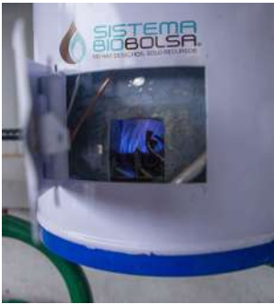
Biogás en calentador de agua