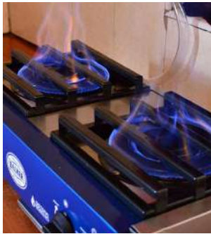
Estufa de biogás