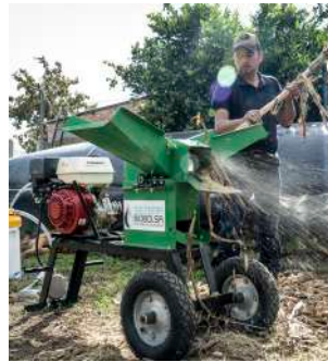
Picadora funcionando con biogás

Manejar los desechos de su finca con Sistema.bio reduce el impacto ambiental y posibles penalizaciones.